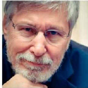
Dr. Bessel van der Kolk